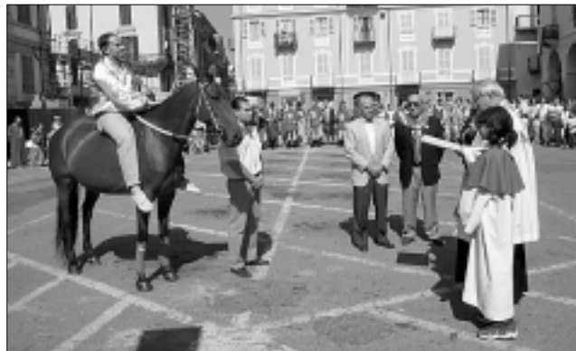
La benedizione di fantino e cavallo.