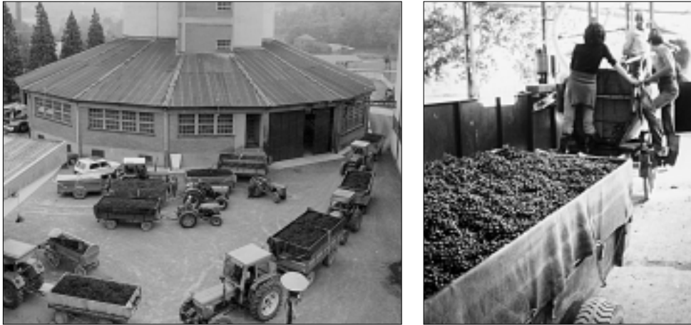
A sinistra il conferimento dell'uva alla cantina sociale. A destra bigonze e vendemmiatori.

Ovada. Mentre si sta effettuando la vendemmia, a Torino la Giunta Regionale ha approvato il Piano di Sviluppo Rurale 2000-2006, presentato dall'assessore all'Agricoltura Deodato Scanderbec.