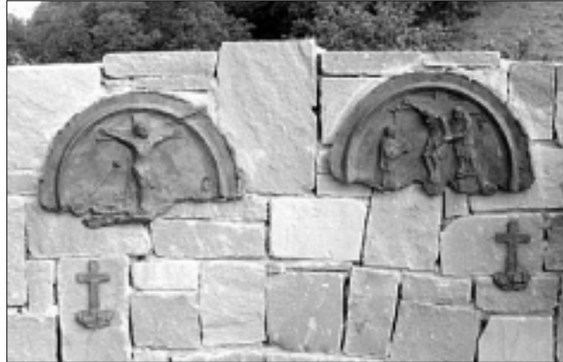
La 12ª stazione: Gesù muore sulla croce; la 13ª: Gesù è deposto dalla croce e consegnato alla madre.