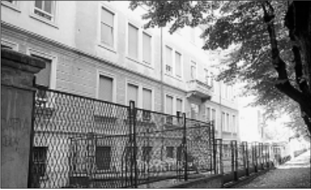
La Casa di Riposo "Papa Giovanni XXIII" in viale Don Bosco.

Nizza M.to. E' ancora la Casa di Riposo a tenere "banco" nella politica nicelese.