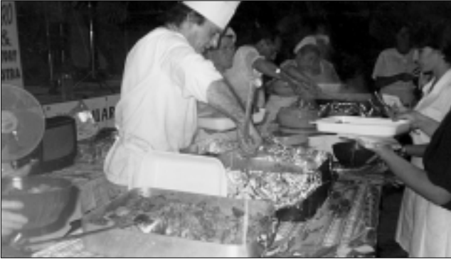
Un momento di "Calici di stelle" a Quaranti.