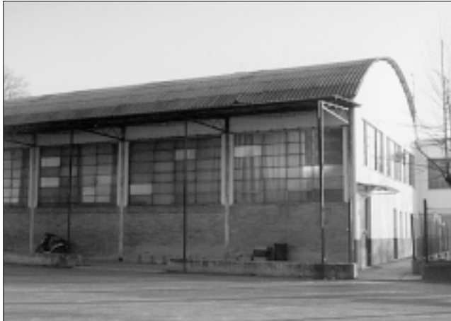
Il Bocciodromo dell'Oratorio Don Bosco.

Nizza M.to. L'Associazione Boccifila Nicelese con sede presso il Bocciodromo dell'Oratorio Don Bosco di Nizza Monferrato organizza il "9° Trofeo del Barbera e Moscato Città di Nizza Monferrato", torneo notturno a quadrette senza vincolo di società.