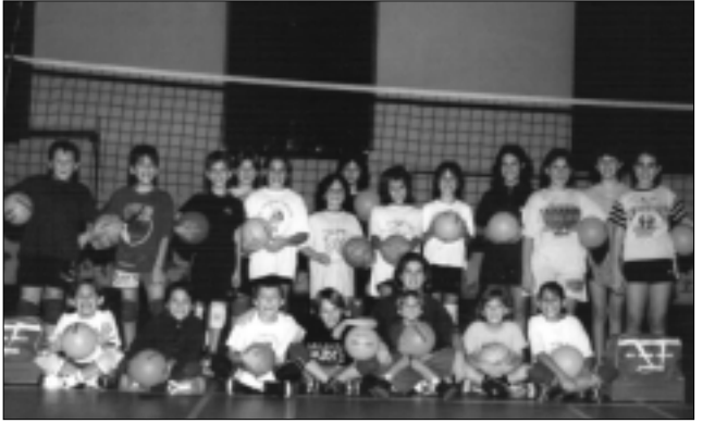
Un gruppo della scuola di pallavolo.