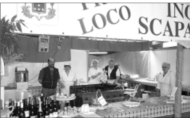
La Pro Loco di Incisa Scapaccino.

Il 21 settembre segna ufficialmente la fine dell'estate.