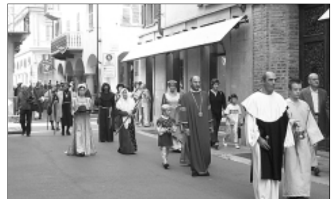
I figuranti del corteo storico.

mentre al secondo posto si è classificato il Borgo S. Paolo.